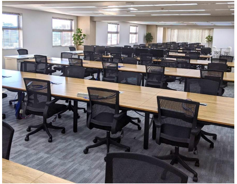
オペレーションルーム